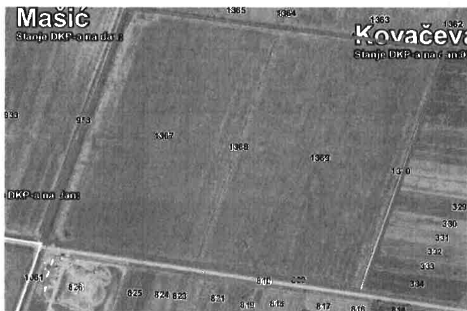
Slika 2: Lokacija RCGO Šagulje na području k.o. Kovačevac (Nova Gradiška)

Lokacija je definirana u Prostornom planu Grada Nove Gradiške, kao i u županijskom Prostornom planu za Županijski/Regionalni centar za gospodarenje otpadom, a u državnom planu gospodarenja otpadom je označena kao lokacija budućeg Regionalnog centra za gospodarenje otpadom.